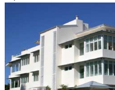
Sistema GECOL TERM ETICS rehabilitación